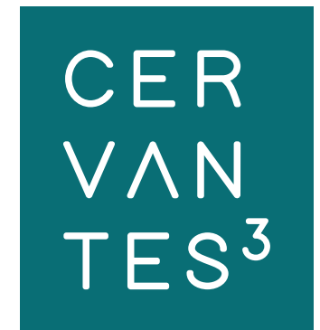
Versión sobre fondo de color