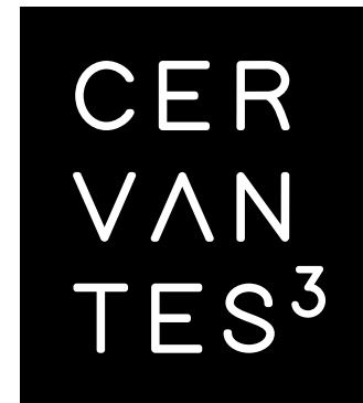
Versión en negativo