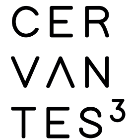
Versión escala de grises