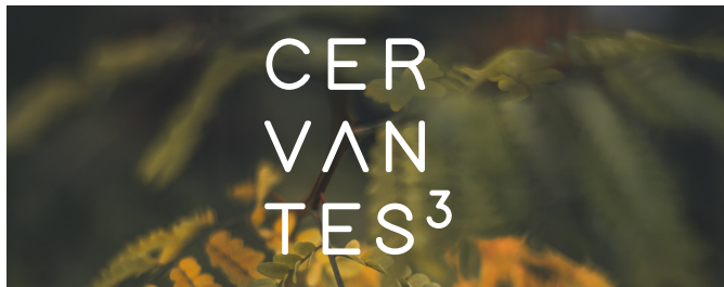
Versión sobre fondo fotográfico oscuro