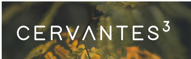
Versión sobre fondo fotográfico oscuro