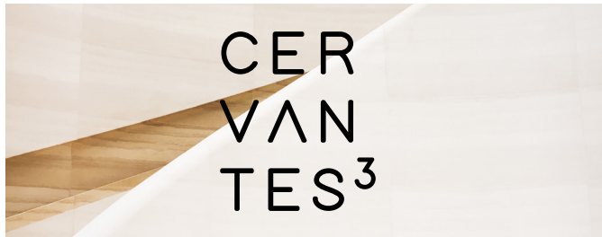
Versión sobre fondo fotográfico claro

Para el logotipo vertical, las versiones serán las siguientes: