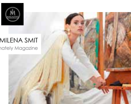
MILENA SMIT Intimately Magazine