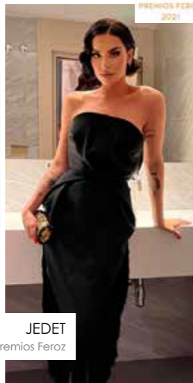
JEJET Premios Feroz