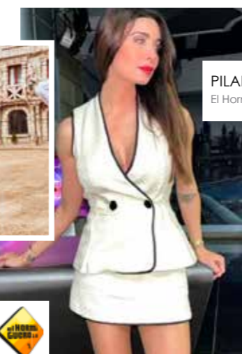
PILAR RUBIO El Hormiguero (Antena3)