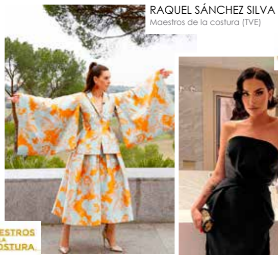
RAQUEL SÁNCHEZ SILVA Maestros de la costura (TVE)