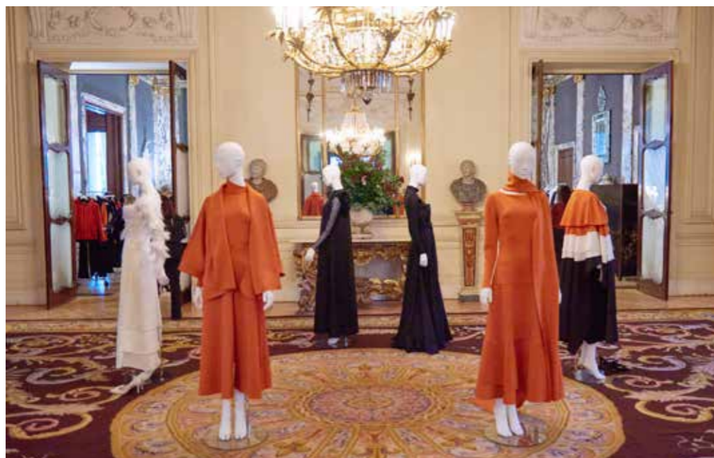
Embajada de Italia, Madrid

Las acciones de comunicación que realizamos incluyen desde lanzamientos y presentaciones de productos y nuevas colecciones hasta desfiles de moda con convocatoria de prensa y ventas privadas.