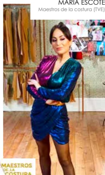
MAESTROS DE LA COSTURA