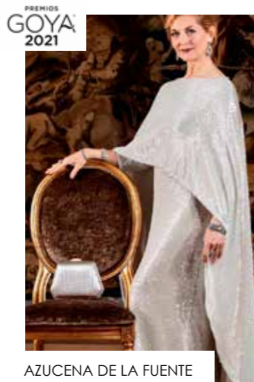
AZUCENA DE LA FUENTE Premios Goya