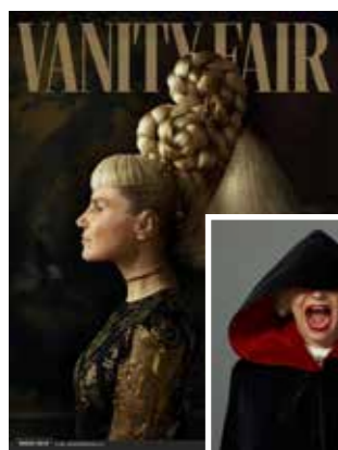
EUGENIA MARTÍNEZ DE IRUJO Vanity Fair

La estética bebe del chic francés pero, con sede en Madrid, se apoya en lo cualitativo y duradero de una manufactura que se hace por entero en España, de forma ética.